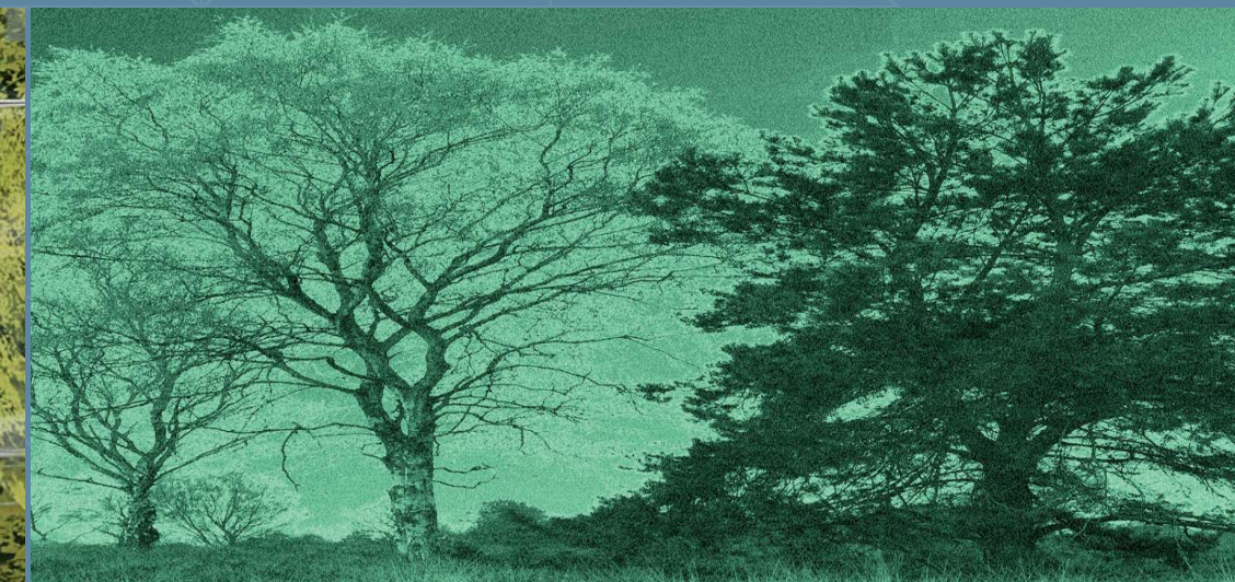
▲ De standaard afbeelding voor de Levensgalerij.