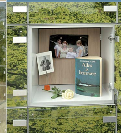
▲ De voorste kamer van een Levenskluis.