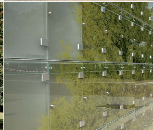
▲ De deurtjes vormen één groot geheel.